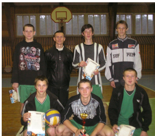
Наши спортсмены — волейболисты!