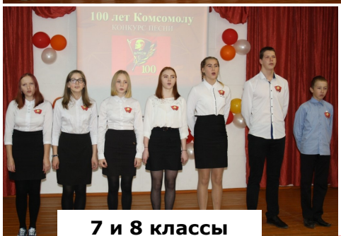
7 и 8 классы