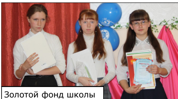
Золотой фонд школы

20 мая в нашей школе прошел очередной «Звездопад», где многие ученики Строевской школы получили заслуженные грамоты, дипломы и сертификаты. Думаю, очень приятно получить вознаграждение после трудной работы, выполненной в этом году. Знаю, что учителя и сверстники гордятся друг другом и своими достижениями.