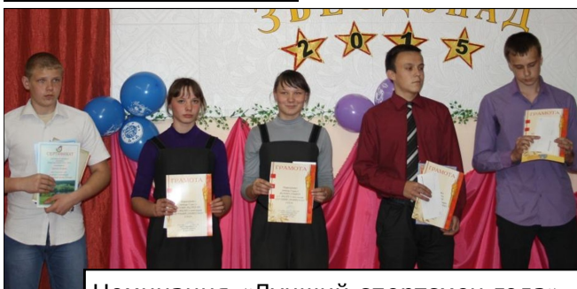
Номинация «Лучший спортсмен года»