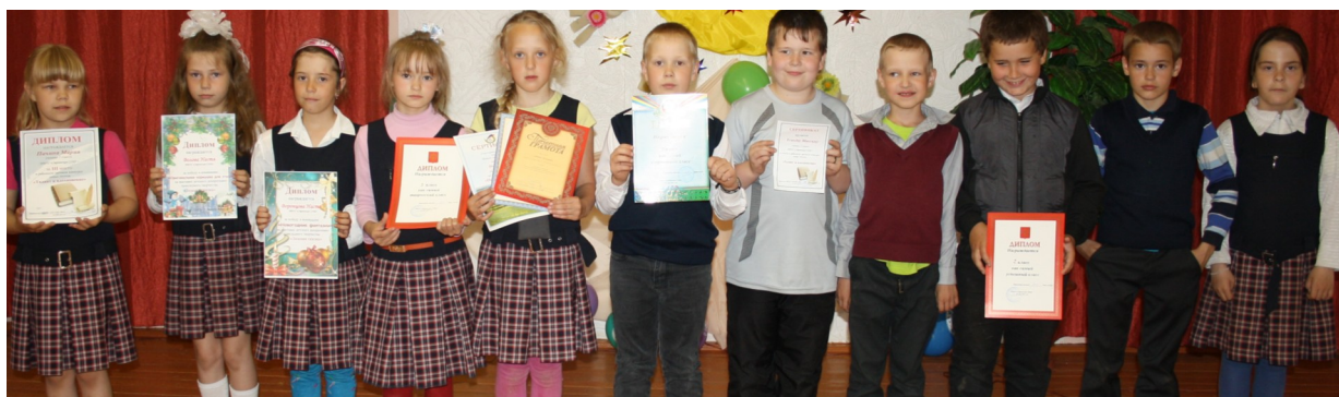
Самый спортивный, творческий и успешный класс