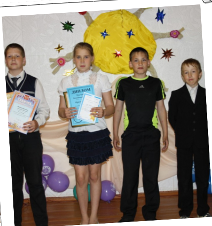
Выпускной 4 класс