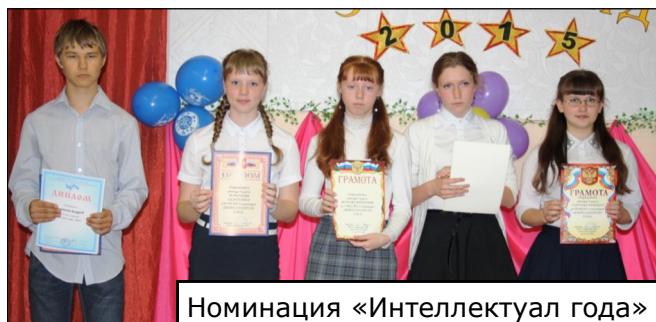
Номинация «Интеллектуал года»