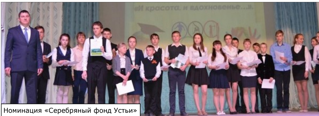
Номинация «Серебряный фонд Устьи»