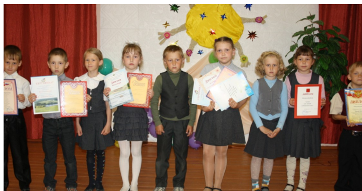
Самый активный класс