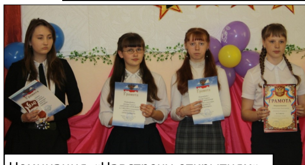
Номинация «Навстречу открытиям»