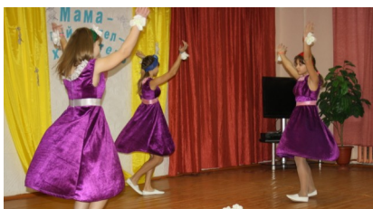
Девчонки из танцевального коллектива «Грация» как всегда очаровательны!