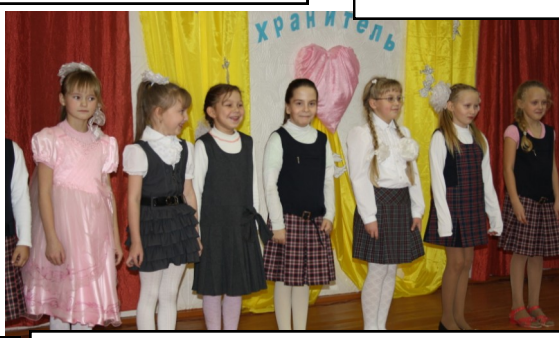
Песня «Мама-почемучка» в исполнении детского хора прозвучала весело и задорно