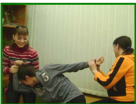
Слабый пол сильнее сильного в силу своей слабости...