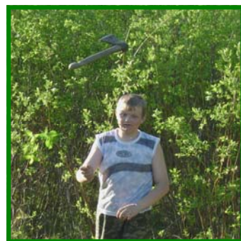
По щучьему велению, по моему хотению...