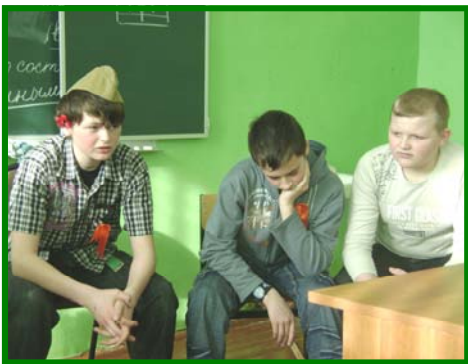
Соображали на троих...