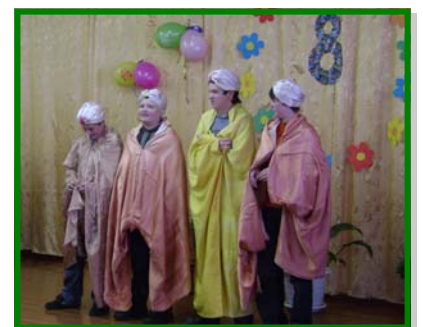
Если б я был султан...