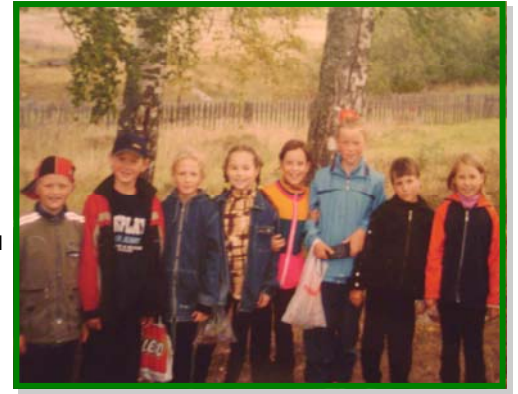
Наш первоначальный состав

В нашей школе 8 класс отличается особой оригинальностью, как во время уроков, так и во время перемен. Вместе с 11 классом на переменах они то играют в футбол чьим-то валенком, то в теннис дневниками, то носятся по школе, как первоклашки (вернее, за ними, а бывает и от них). На уроках 8 класс тише воды, ниже травы (вернее с точностью до наоборот). Мальчишки отличаются особым рвением к заигрыванию с противоположным полом, а также неиссякаемым запасом всевозможных приколов и авантур. Особенно поражают их физические возможности, они могут развивать немыслимую скорость передвижения от класса до столовой. Девчонки же с каждым годом становятся всё взрослее и прекраснее. Ни одно мероприятие не обходится без участия этой прекрасной половины 8 класса. Ум, активность, оригинальность и, конечно же, красота - всё это предмет зависти и восхищения всей школы. Так держать! ;)))