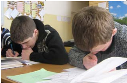
Грызём гранит науки

можно, это и к лучшему, ведь принято считать, что она легче. Но, так или иначе, всем хочется пожелать удачи на ГИА и при дальнейшем поступлении в учебные заведения!