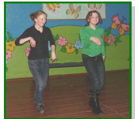
Арам зам зам, арам зам зам...