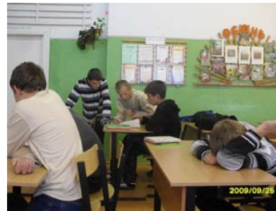
Перед уроком. Каждый занят чем-то без сомнения важным