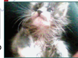
Знакомьтесь, кот Умка

26 сентября состоялся первый тур игр ЧГК (Что? Где? Когда?) по МКМ. В игре приняли участие 2 команды из нашей школы: «Умка» и «Фаворит».