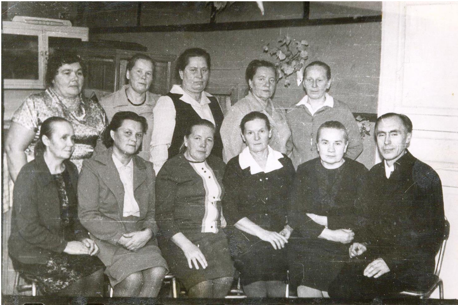
С коллективом учителей.