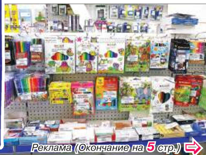
Реклама (Окончание на 5 стр.) ➡