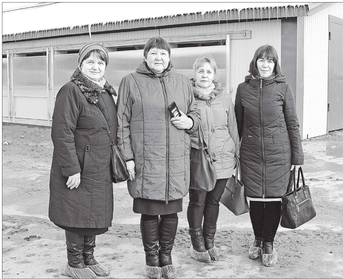
Выпускницы 10а кл. Строевской средней школы пришли работать на ферму в 1979 г.

А нам, кто проводил идеологическую работу, кто трудился на фермах в те годы наравне с опытными животноводами, хотелось бы, чтобы на страницах